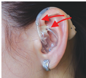
Špatné nasazení do ucha