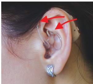
Správné nasazení do ucha